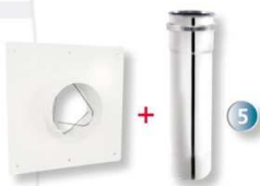
Plaque de finition basse blanche avec raccord concentrique + rallonge télescopique