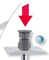
Terminal vertical avec plaque d'étanchéité haute