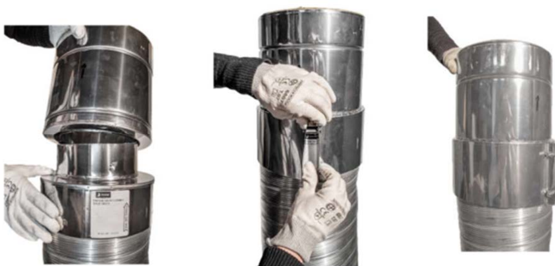
Emboîter l'adaptateur conduit double paroi/ Conduit flexible VELA

Adaptateur bas : conduit double paroi/Conduit flexible VELA