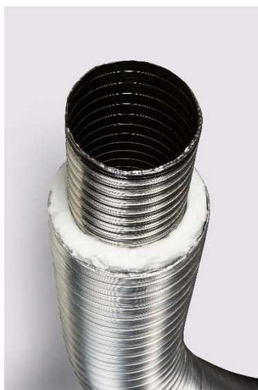
Figure 1 – Procédé Conduit flexible isolé VELA