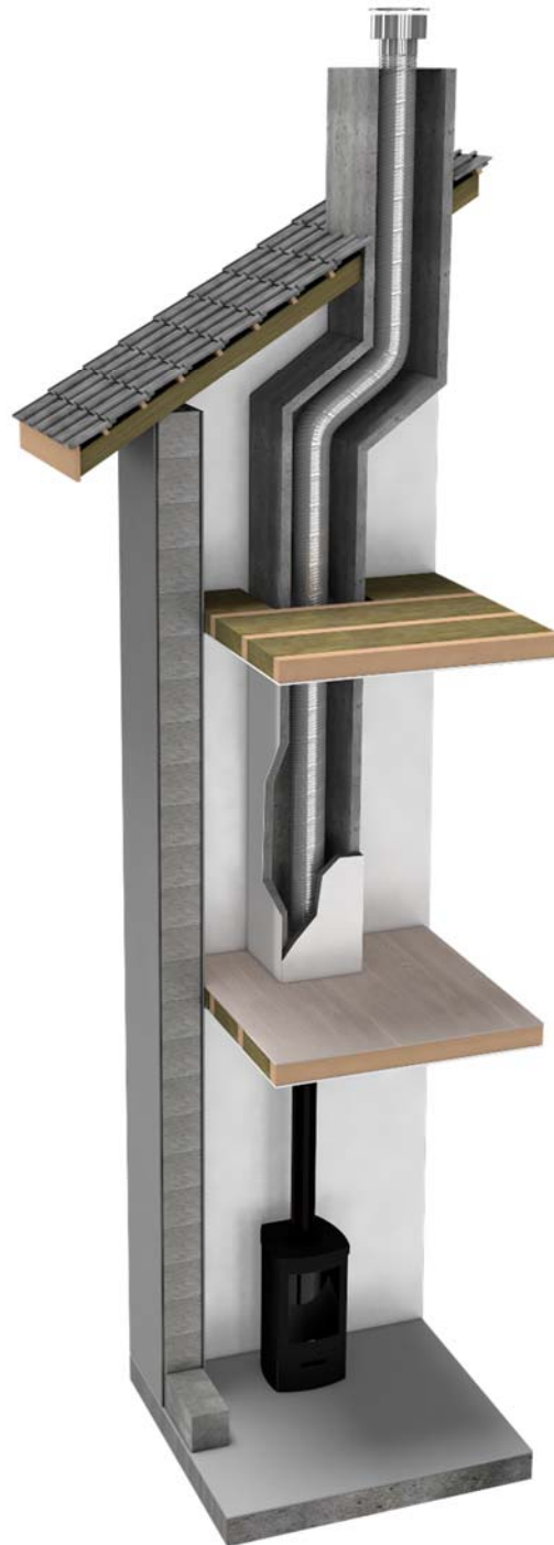
Figure 4 – Installation dans un conduit existant